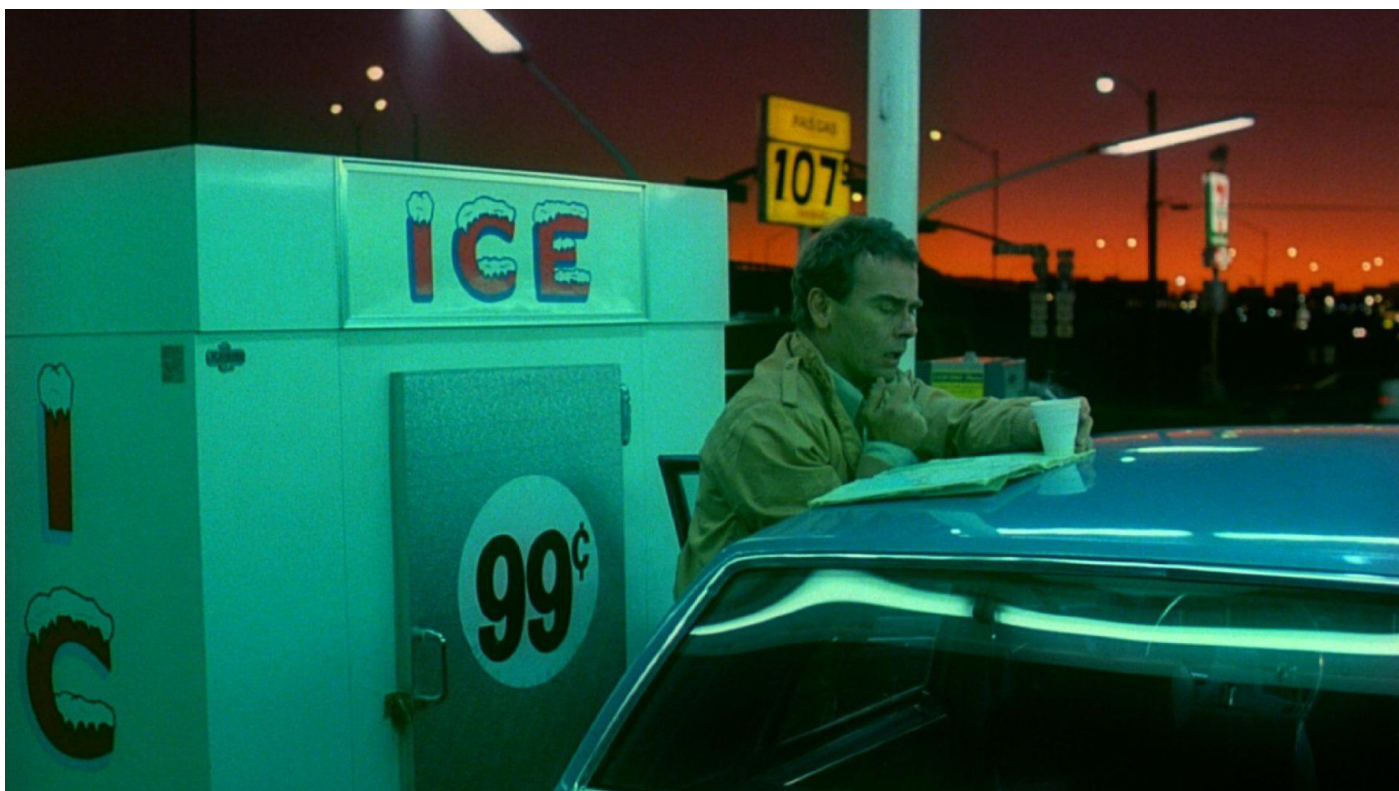
Wim Wenders, Paris, Texas , [film], 1984.