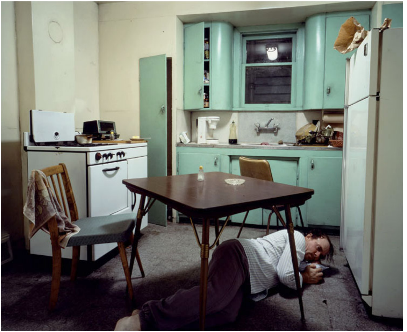
Jeff Wall, Insomnia , 1994.