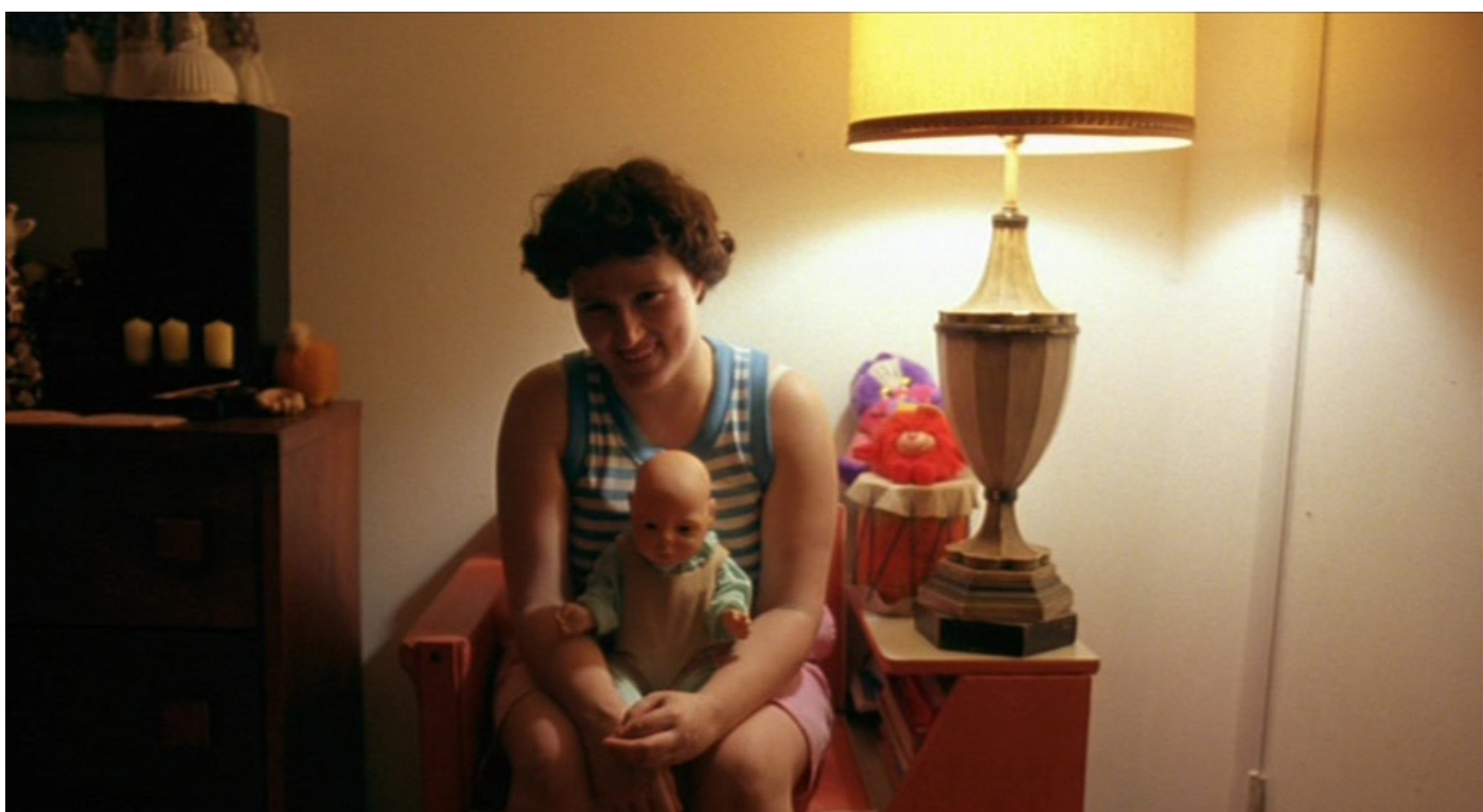
Harmony Korine, Gummo , [film] 1997.