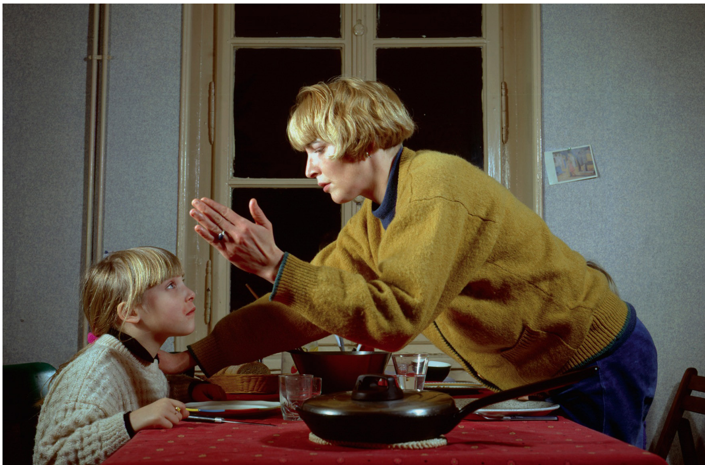
Florence Paradeis, La Menace , 1991.