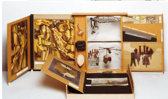
Diverses boîtes en valise de Marcel DUCHAMP depuis 1936 ces objets sont des Icônes référentielles de l'art du 20 e