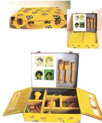
Valises amoches portables des jeunes