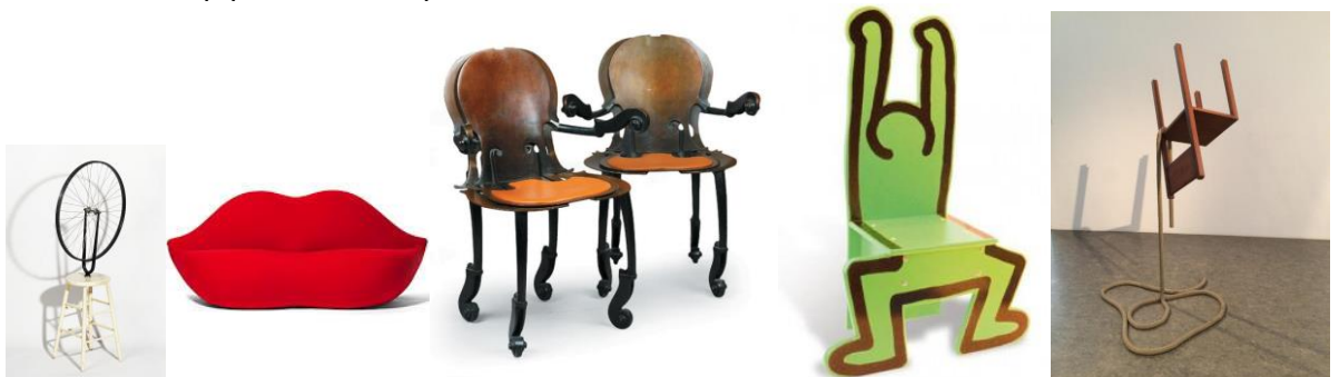
6/Duchamp Marcel « ready made » 7/ Dali Salvador « Canapé Bocca » 1936 8/ Arman « paire de fauteuil Violoncelle » vers 1970. 9/ Chaise Keith Haring par Vilac . 10/Philippe Ramette « Chaise en lévitation »

Le métal et le tube remplacent le bois dans les productions des années 1920 allant de pair avec une rationalisation et une fonctionnalisation liées à la production industrielle . Ces formes font parties des standards occidentaux européens et sont passées depuis la 2 me moitié du 20 e siècle aux standards culturels de la mondialisation , par contre le public croit que ces mobiliers sont beaucoup plus récents qu'ils ne sont en réalité.