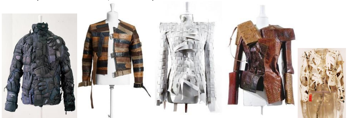
15/16/17/18/19 Diverses créations contemporaines du créateur couturier belge Martin Margiela par assemblage, collecte, fragmentation, réassemblage et détournements d'objets et accessoires textiles de reformes et de rebuts