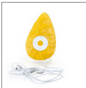
Luke Newton, I-Axe Nano Series , 2012, 21 x 16,5 x 16,5 cm.