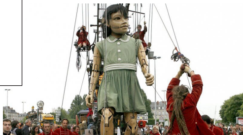
Royal Deluxe / Les machines de l'île, La Petite géante , acier, bois, crin de cheval, 5,5 m (800 kg)