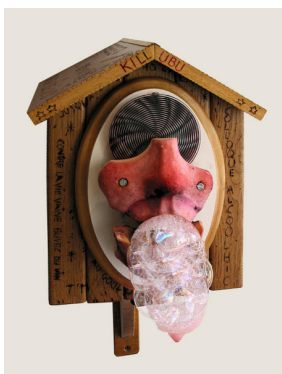
Philippe Mayaux, Kill Ubu , 2008 / Camelot , 1999