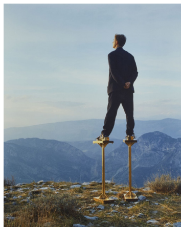
Philippe Ramette, Socle à réflexion , 2002, photographie.