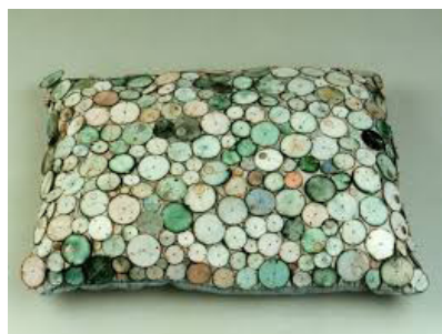
Chantal Raguét, Coussin fakir , 2001. Fil d'inox et de soie, cadrans de montres, bourre, satin et velours, 13 x 50 x 37 cm.