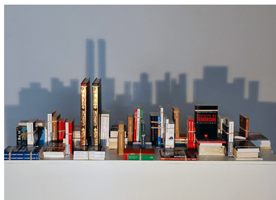
Mounir Fatmi, Save Manhattan 01 , 2003-04. Livres, élastiques, projecteurs, env. 150x90cm.