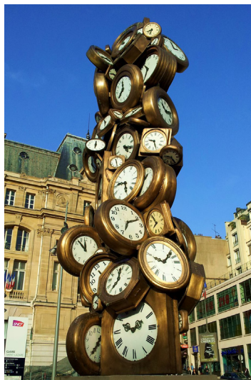
Arman, L'Heure de tous , 1985. Horloges, bronze. 4,6x1,5x1,8 m.