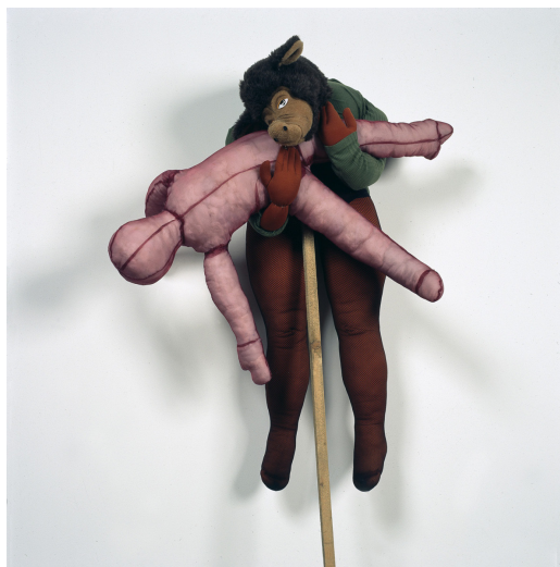
Annette messenger, Articulés-Désarticulés , 2001-2002