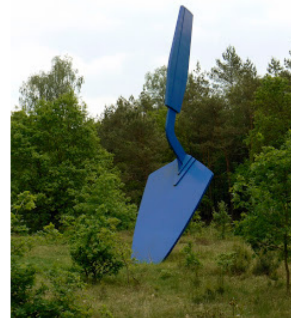
Claes Oldeburg, Truelle I , 1971-76. Acier et émail polyuréthane, 12.7x3.4x4.4m