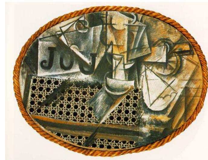
Pablo Picasso, Nature morte à la chaise cannée , 1912. Huile et collage sur toile, 27x35cm.