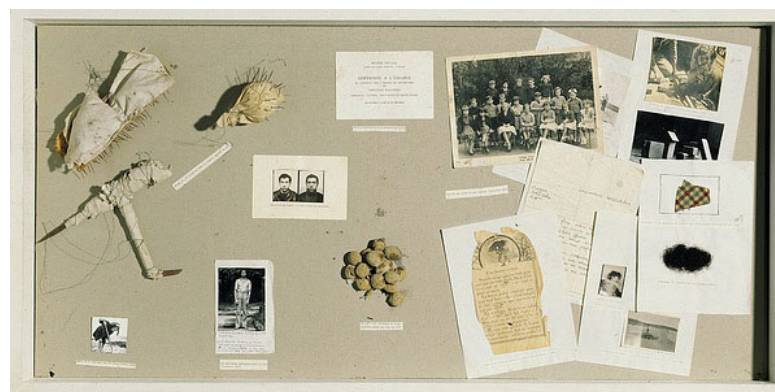
Christan Boltanski, Vitrine de référence , 1971. Bois, plexi-glas, photos, cheveux, tissus, papier, terre, fil de fer