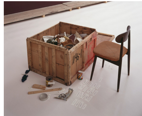
Ilya Kabakov, La Caisse de détrit , 1983. Installation.