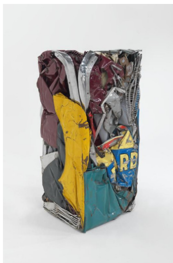
César, Compression "Ricard" , 1962. Compression dirigée d'automobile.