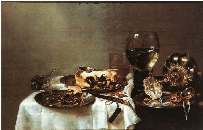
Willem Claeszoon Heda, Table de petit déjeuner avec tourte aux myrtilles , 1631. Huile sur bois, 54x82 cm.