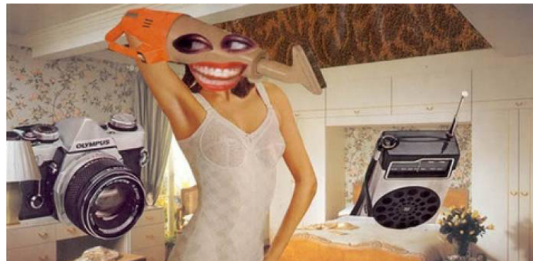
Linder Sterling, Untitled , 1972.. Photocollage, 136x210mm.