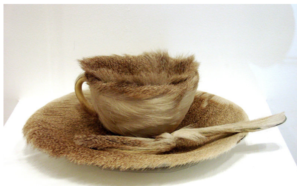
Meret Oppenheim, Objet , 1936. Objets, fourrure de gazelle.