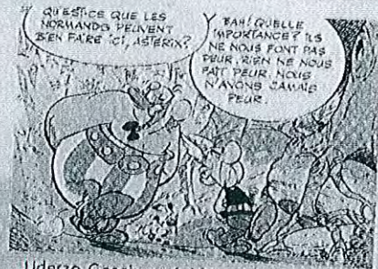
Uderzo, Goscinny, Astérix et les Normands , Albert René.