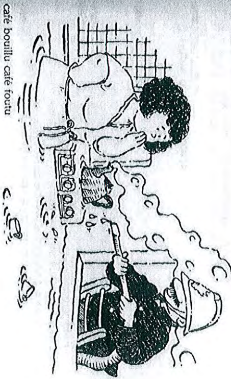
café bouillu café foutu